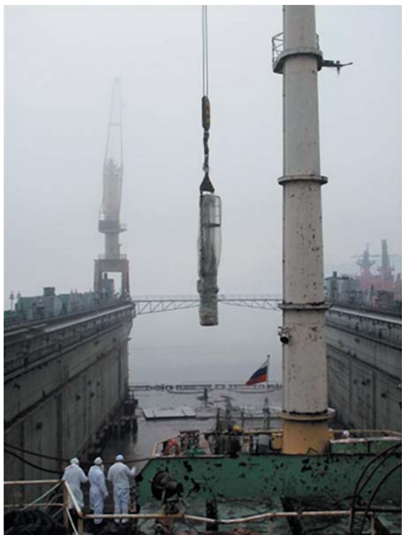
Рис. 3. Выгрузка крупногабаритных ТРО и оборудования при подготовке к переводу на завод утилизации

За основу утилизации судна приняты положения «Концепции комплексной утилизации атомных подводных лодок (АПЛ) и надводных кораблей (НК) с атомными энергетическими установками». Концепция предусматривает вырезку блоков реакторных отсеков утилизируемых АПЛ, НК и их длительную выдержку (около 70 лет) в пункте длительного хранения радиоактивных отходов (ПДХ РО) «Сайда».