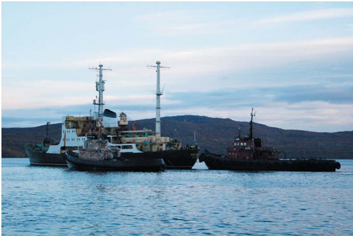
Рис. 5. Буксировка ПТБ «Лепсе» на СРЗ «Нерпа»

Для подготовки ПТБ «Лепсе» к перегону было произведено ее комплексное инженерное обследование, на основании которого ОАО «171 ОКТБ» разработало «Технический проект буксировки». Он получил одобрение Российского морского регистра судоходства. В соответствии с требованиями этого проекта на ФГУП «Атомфлот» были выполнены мероприятия, обеспечивающие необходимые мореходные качества судна: