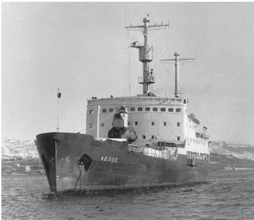
Рис. 1. ПТБ «Лепсе» на рейдовой стоянке после возвращения из похода

судостроительном заводе, но в 1936 г. оно было приостановлено, а судно законсервировано. В 1937 г. достройка судна была поручена Херсонскому судостроительному заводу им. Коминтерна. Однако его строительство не было закончено, и в 1941 г. судно отбуксировали из Херсона в устье реки Хоби (Хобисцкали), приотплено открытием кингстонов и засыпано песком для образования брекватера. В 1945 г. после окончания Великой Отечественной войны судно было поднято силами Управления аварийно-спасательных, судоподъемных и подводно-технических работ Черноморского флота и отбуксировано в порт Потти. По прямому назначению в качестве сухогрузного теплохода судно не использовалось и в соответствии с проектом № 325 ЦКБ «Айсберг» было переоборудовано под плавучую техническую базу для обеспечения перезарядок топлива ядерной энергетической установки ОК-150 атомного ледокола «Ленин». ПТБ «Лепсе» поднята на стапель 5-С ленинградского Адмиралтейского завода 22 января 1958 г., спущена на воду 3 июня 1961 г. и предъявлена к сдаче приемной комиссии 25 декабря 1961 г.