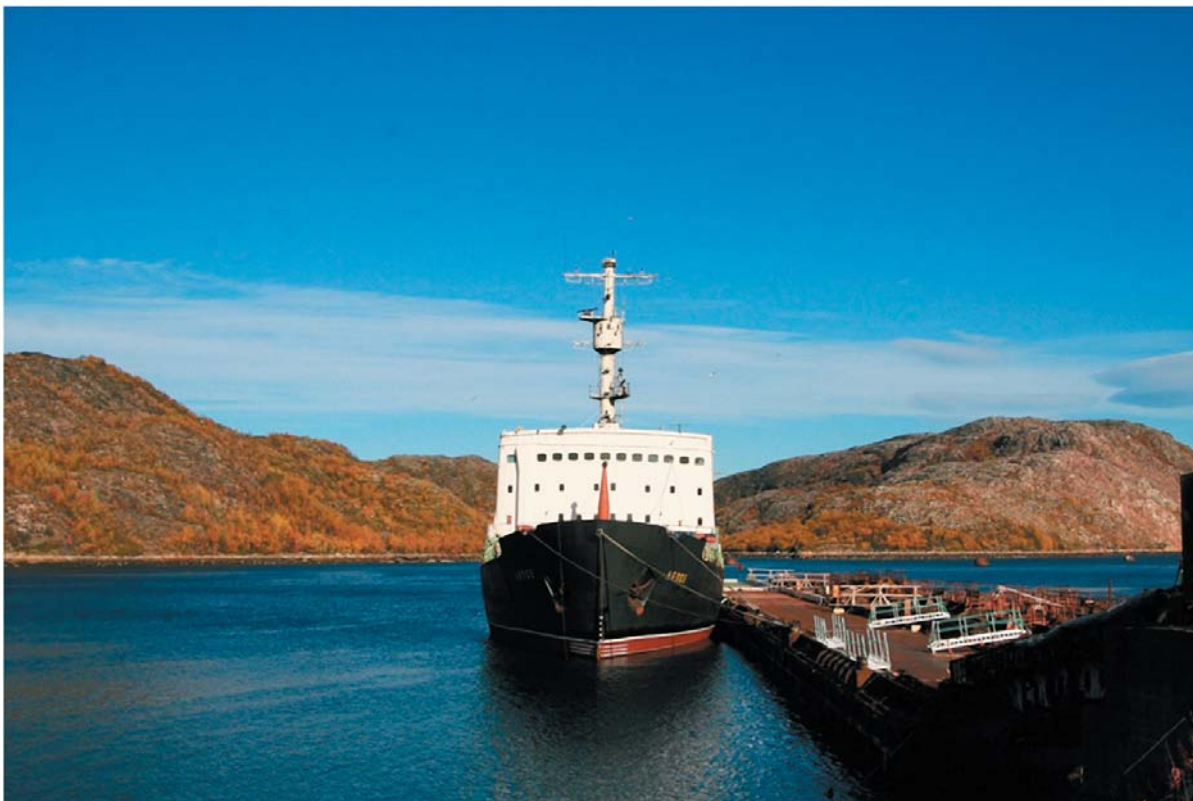
Рис. 6. ПТБ «Лепсе» ошвартована у плавпричала СРЗ «Нерпа»

14 сентября 2012 г. буксировка ПТБ «Лепсе» была выполнена, и судно пришвартовано к плавпричалу СРЗ «Нерпа».