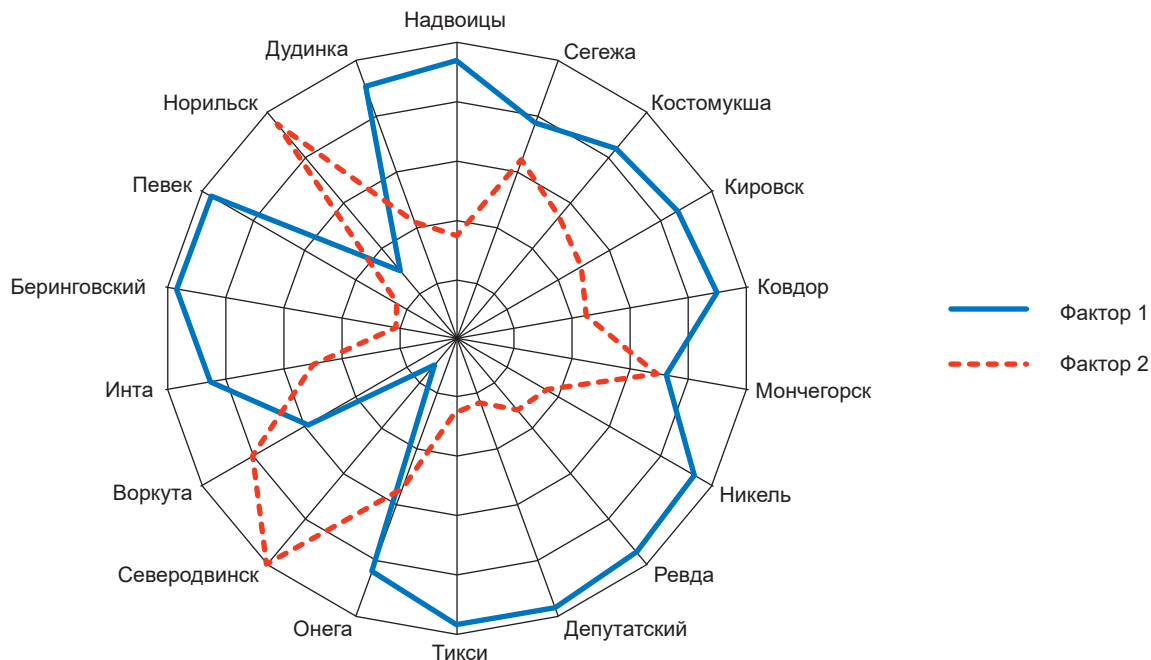
Рис. 4. Миграционная модель моногородов Арктики. Составлено авторами по данным экономической статистики Fig. 4. Migration pattern of single-industry towns in the Arctic. Compiled by the authors based on economic statistics

зафиксировано бережное отношение к вопросам охраны окружающей среды.