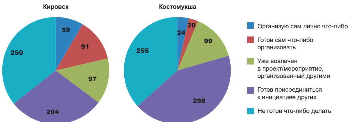
Рис. 3. Готовность жителей городов устраивать мероприятия по защите окружающей среды по результатам опроса в моногородах Кировске и Костомукше, 2021 г. Составлено авторами по данным социологических опросов Fig. 3. Willingness of urban residents to arrange environmental protection measures according to the survey results in single-industry towns Kirovsk and Kostomuksha, 2021. Compiled by the authors based on sociological surveys

При оценке экологических проблем моногородов важна экологическая ответственность бизнеса, работающего в АЗРФ. Как следует из исследований, «повышенной экологической ответственностью» обладают 12 моногородов из 18 (в Норильске, Мончегорске, Дудинке, Никеле это ПАО «ГМК «Норильский никель», АО «Русал» в Надвоицах, ПАО «ФосАгро» в Кировске, ПАО «Сережа Групп» в Онеге и Сегеже, АО «Полиметалл» в Певеке, ПАО «Северсталь» в Костомукше, ООО «Ловозёрский горно-обогатительный комбинат» в Ревде, ООО «Берингпромуголь» в Беринговском). Перечисленные моногорода формируют так называемую зеленую зону — в них